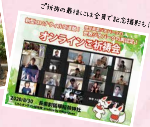
ご祈禱の最後には全員で記念撮影も!