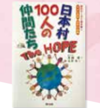
日本村100人の仲間たち The HOPE (辰巳出版)