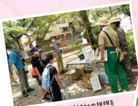
ジオガイドさんから稲荷神社の説明も小学生たちと勉強しました。