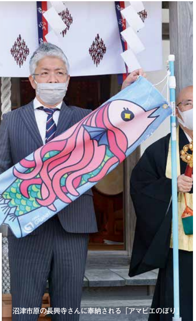
沼津市原の長興寺さんに奉納される「アマビエのぼり」