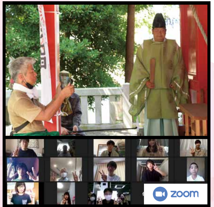
初のオンラインイベントのご祈禱会。参加した27名が中継の様子を見守ります。