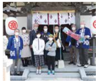
コロナが早く終息するといいですね！

2年ぶりなので少々古いネタもありますがお付き合い下さい。どうぞよろしくお祈りします！